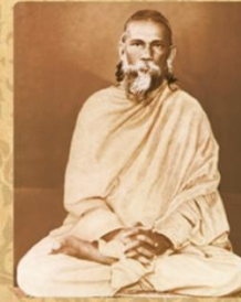
SWAMI SATYANANDA GIRI