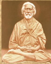
SWAMI SHRIYUKTESHWAR GIRI